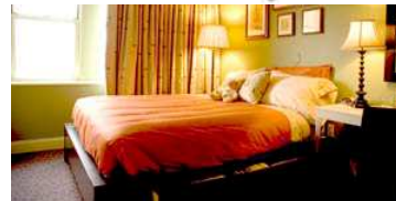
The House on Kent Street A home away from home