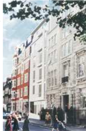
« Paul O'Gorman Patient Hotel » en GOSH

St. Jude Children's Research Hospital ALSAC • Danny Thomas, Founder